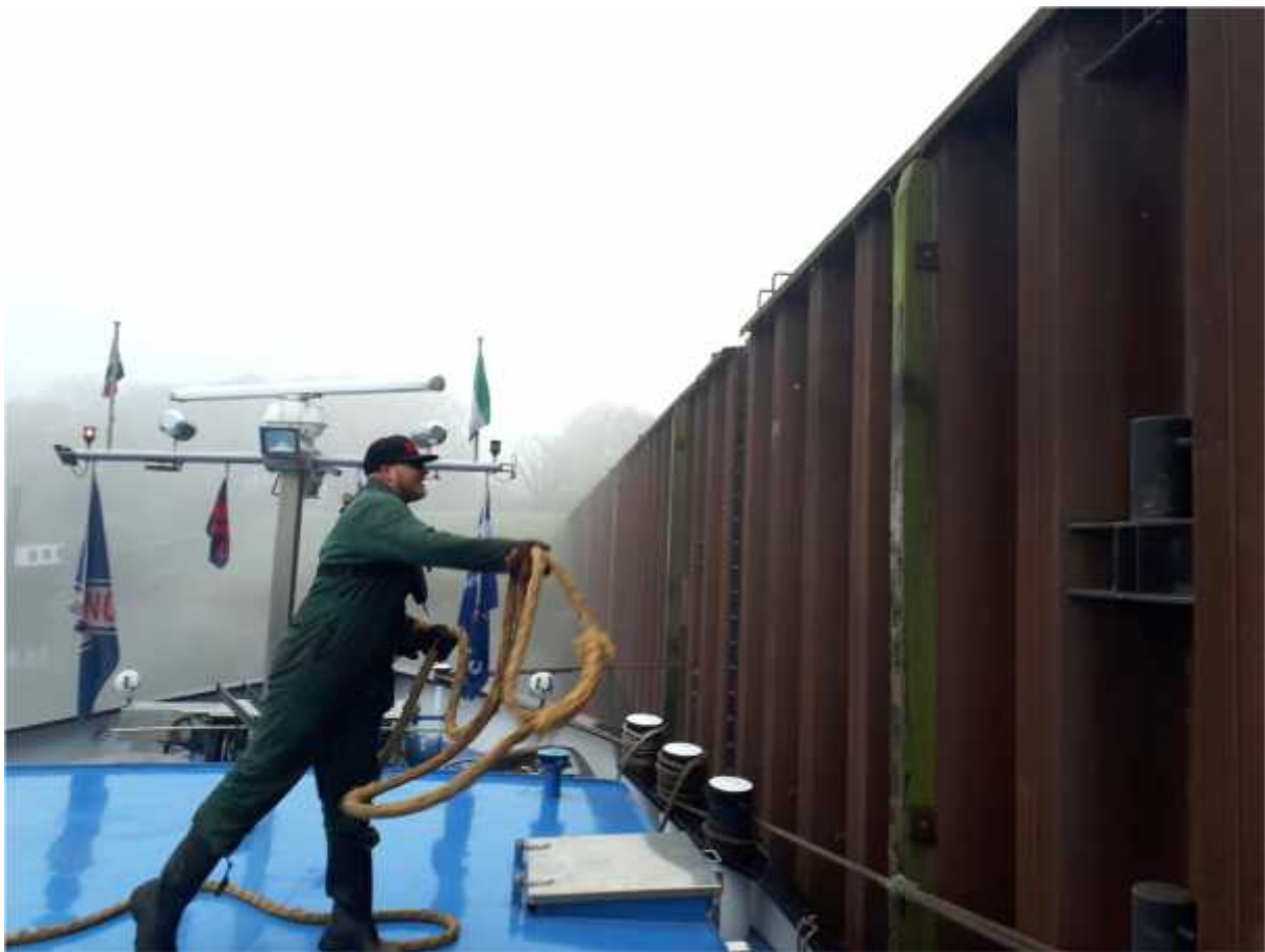
Deelnemer op stage op binnenvaartschip

Met de gemeente Den Helder zijn in 2017 oriënterende gesprekken gestart over de vestiging van een tweede locatie.